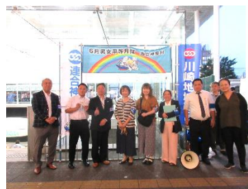
「男女平等月間」をアピールした弁士の皆さん

2024年5月29日(水)18時よりJR川崎駅東口において、連合神奈川の6月「男女平等月間」の取り組みをアピールする「駅頭行動」を実施し、1万2千部のチラシを配布しました。▼参加者は連合神奈川の副事務局長、女性委員会・青年委員会・ジェンダー平等推進委員会など25人、川崎地域連合は議長・代行・共働部会と川崎中央・田島・大師地区などが参加しました。▼